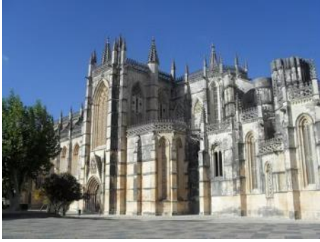
Monastère de Batalha