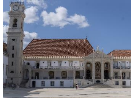
Université de Coimbra